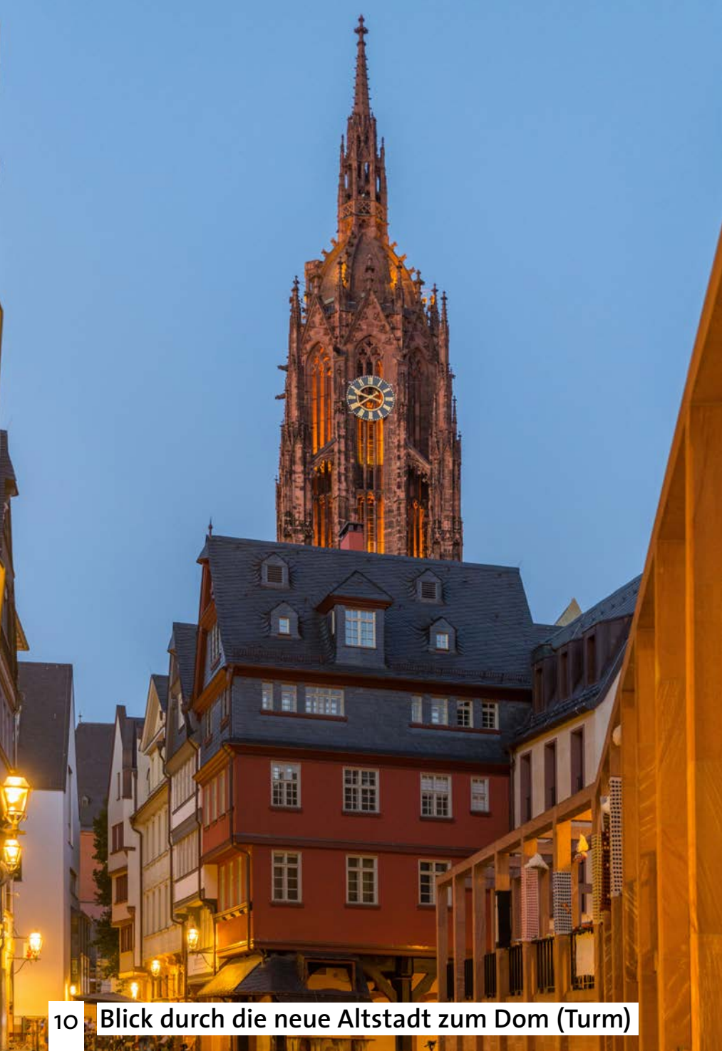
10 Blick durch die neue Altstadt zum Dom (Turm)