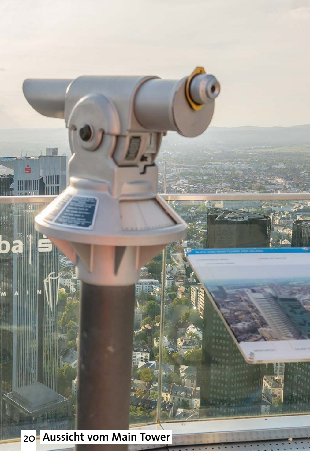
20 Aussicht vom Main Tower