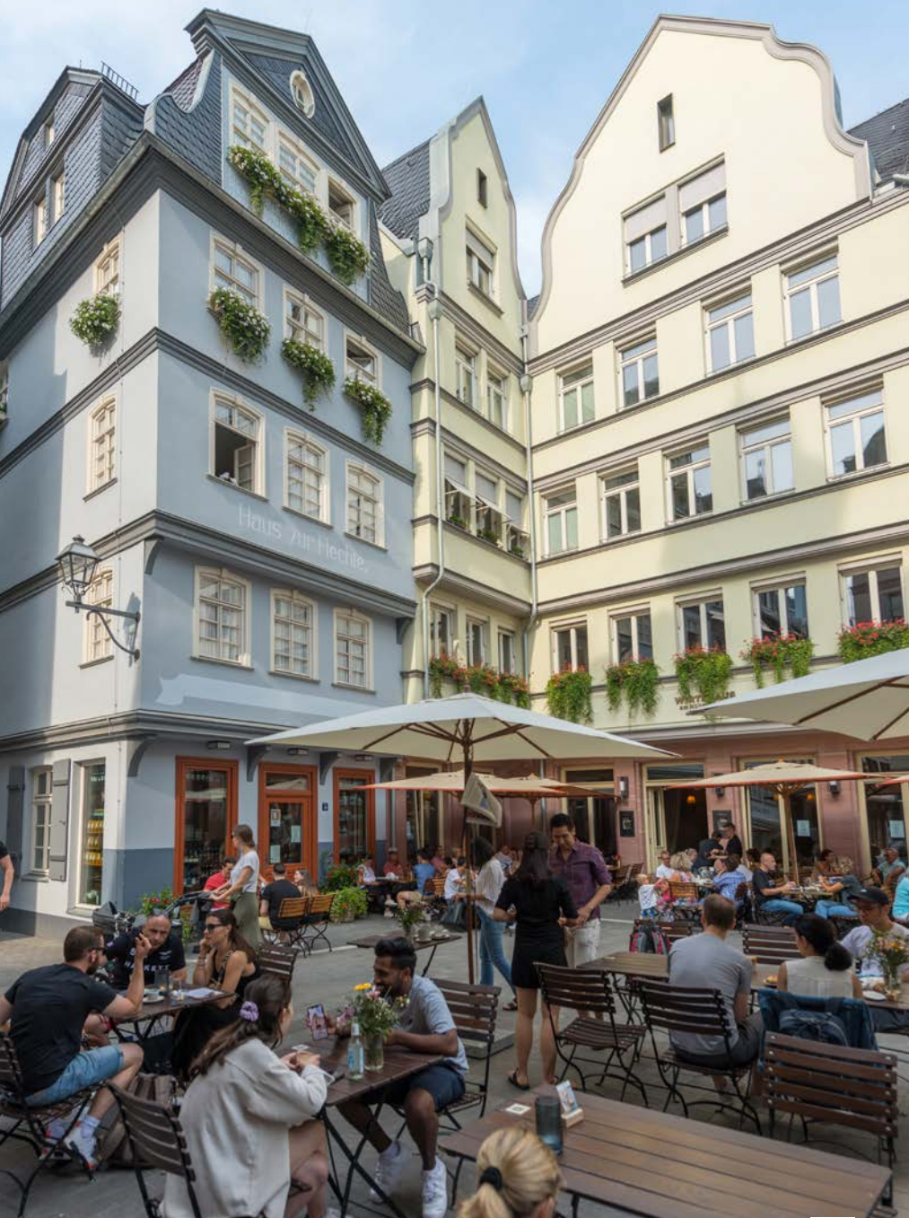
Ein Platz in der neuen Altstadt: der Hühnermarkt 9