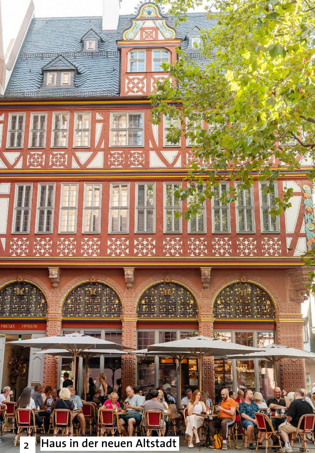
2 Haus in der neuen Altstadt