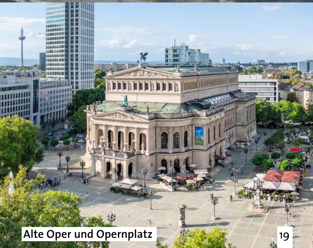
Alte Oper und Opernplatz